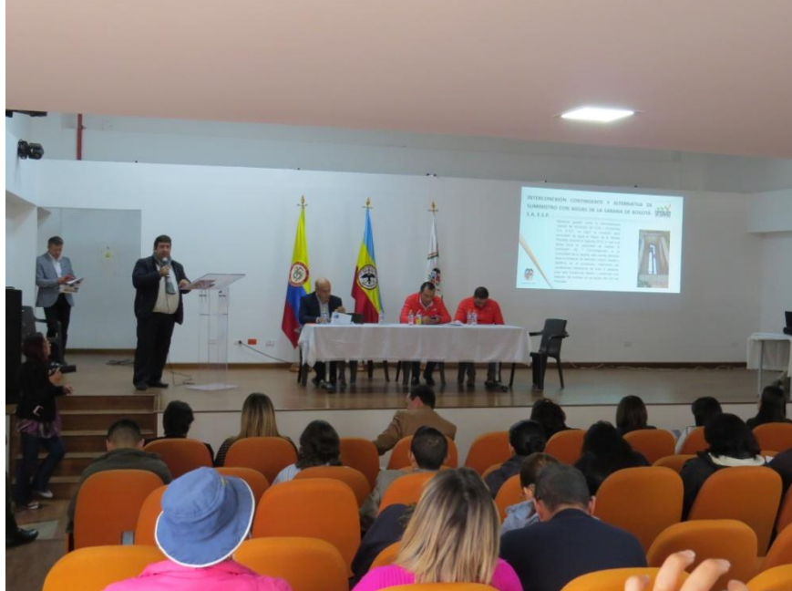
Imágenes: Audiencia de Rendición de Cuentas EMSERCOTA SA ESP- 27/12/2019.